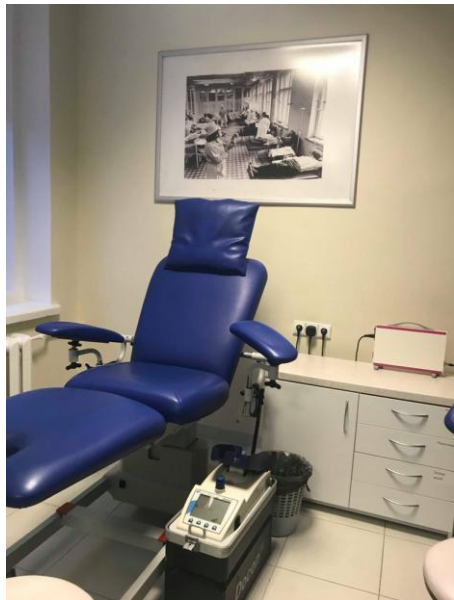
Donoro kraujo paėmimas