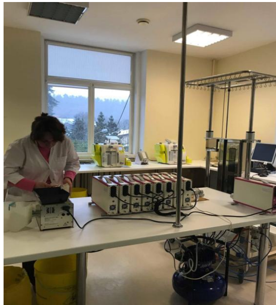
Kraujo komponentų atskyrimas